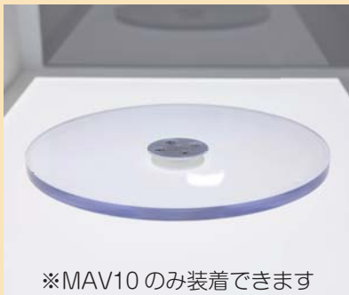
※MAV10 のみ装着できます