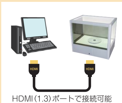
HDMI (1.3) ポートで接続可能